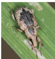
イネミスゾウムシ