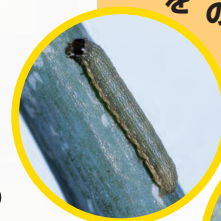
シロイチモジヨトウ